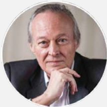
Josep Piqué , Economista, empresario y exministro

14.00 Almuerzo en el al pabellón polivalente. Conferencia “El escenario geopolítico, económico y energético, después de la invasión de Ucrania”