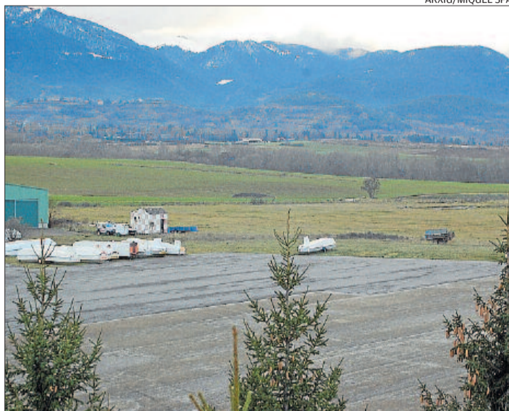
La zona dels hangars de l'aeròdrom de la Cerdanya, a Das i Fontanals

En les últimes reunions celebrades amb Urbanisme, els representants dels dos ajuntaments cerdans han exigint un grau més elevat de protecció de l'entorn de l'aeròdrom a fi de blindar el seu possible creixement futur. En aquest sentit, el nou text establiria fins i tot una prohibició total de construir entre l'aeroclub i la carretera de Soriguerola, on amb l'anterior redactat es podia ampliar, amb una qualificació de protecció natural, segons ha explicat