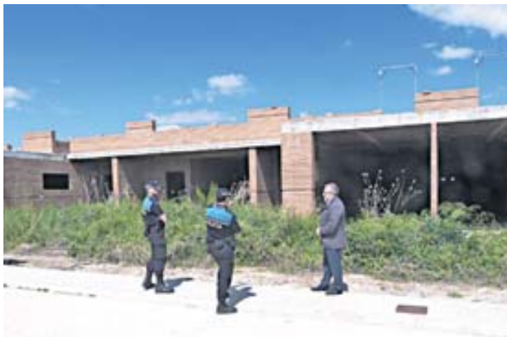
L'alcalde de les Borges va visitar ahir un dels solars afectats

espais d'aquestes característiques per detectar possibles riscos per a la salubritat o la seguretat dels veïns. Quan els agents detecten alguna situació de risc aixequen acta i ho notifiquen als serveis administratius del consistori, que avisen al propietari per a que hi actui o en pagui l'actuació a tercers.