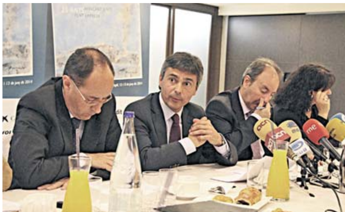
La presentació de la 25a Trobada d'Empresaris del Pirineu va tenir lloc ahir a Lleida