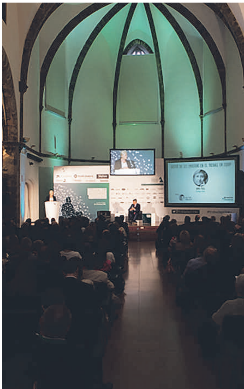
La Seu d'Urgell acull des d'avui la 30a Trobada Empresarial al Pirineu