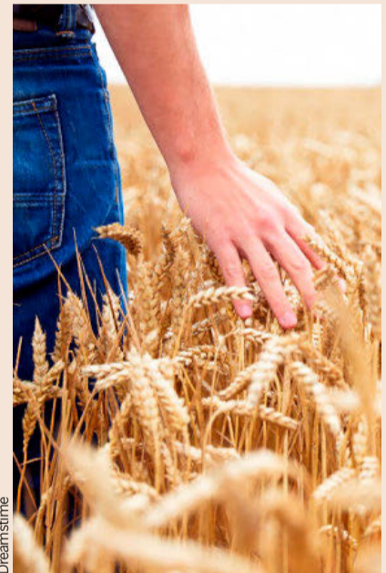
La producción de cereal en Catalunya se estima en 1,5 millones de toneladas.

La agricultura es señalada como una potente fuente generadora de gases, cuando en realidad desempeña un papel esencial en la mitigación del cambio climático dado que extrae de la atmósfera, mediante la fotosíntesis, las emisiones de gases de efecto invernadero. Todavía hay camino por recorrer en el reconocimiento del sector agrario en su contribución a la mitigación del cambio climático y recompensar su aporte, pues el simple hecho de trabajar la tierra conlleva un beneficio