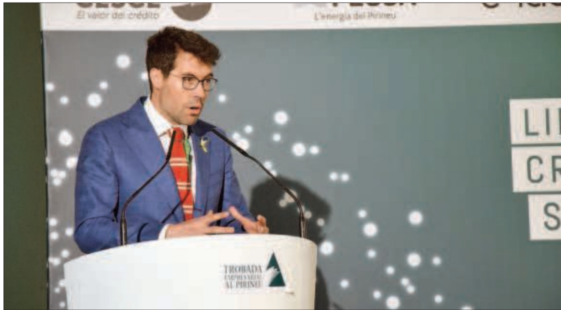
L'alcalde de la Seu d'Urgell, ahir, en la primera jornada de la Trobada Empresarial al Pirineu.

INFRAESTRUCTURES | 29A TROBADA EMPRESARIAL AL PIRINEU