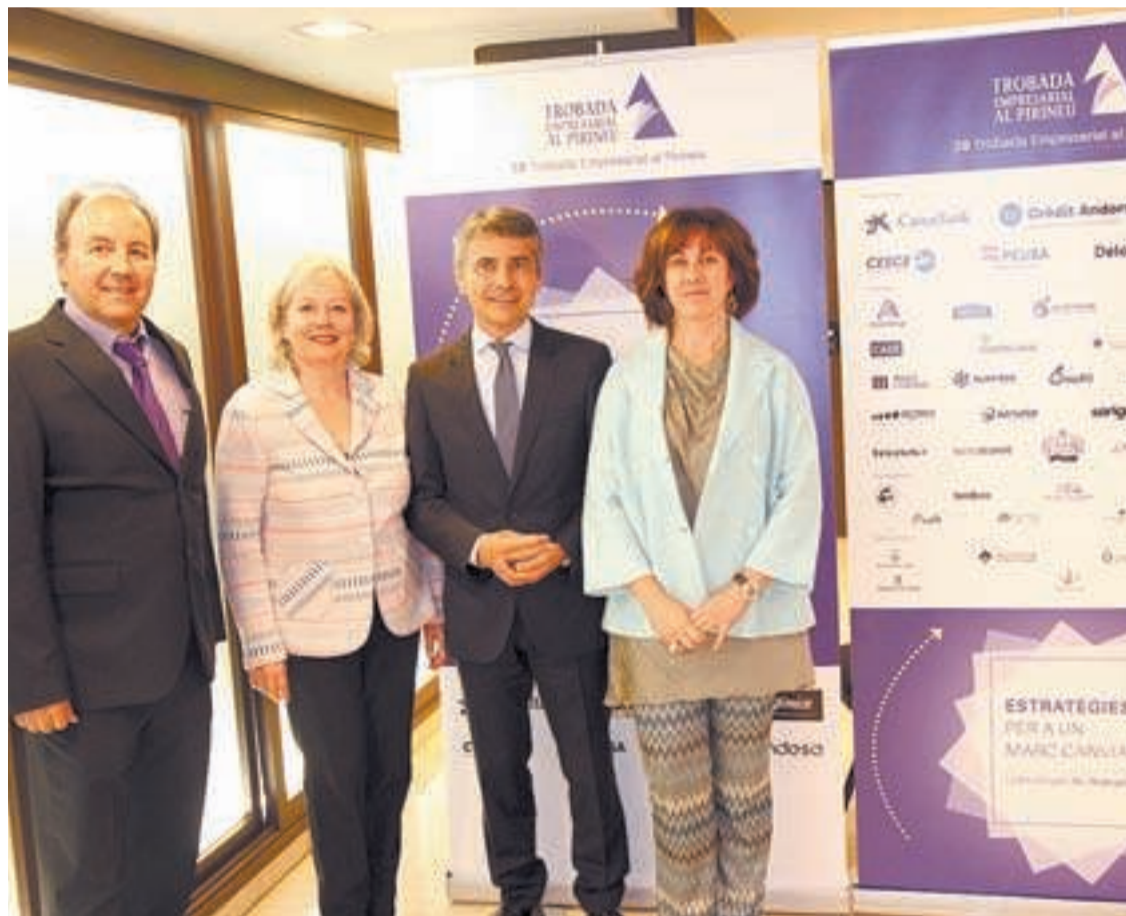
La presentació de la Trobada al Pirineu d'enguany va tenir lloc el 27 d'abril

La 28a Trobada Empresarial al Pirineu pretén aportar les claus per entendre com aquesta complexitat derivada de les situacions polítiques dels països dificulta la presa de decisions i, en conseqüència, també augmenta els nivells de risc. En aquesta edició,